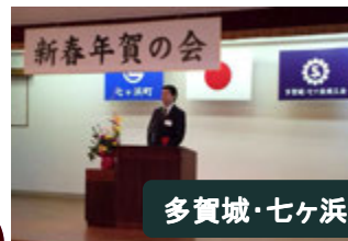
多賀城・七ヶ浜新春年賀の会