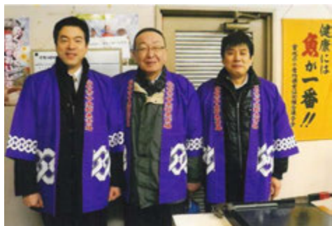
仙台市中央卸売市場業務開始式