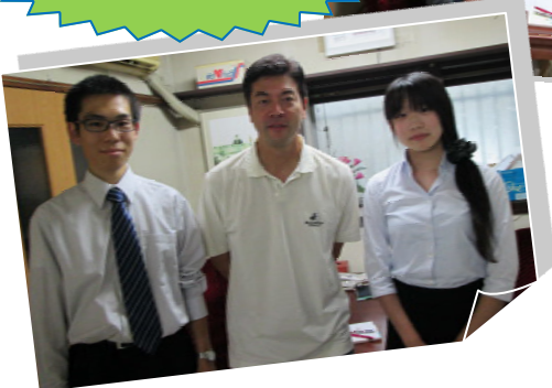
(以上文責*山田、峯岸)